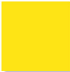
D11050A Chromatint® Yellow RS Liquid pH стабилен в широком диапазоне