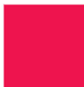
D93292 Chromatint® Red 2006 Liquid pH стабилен в широком диапазоне