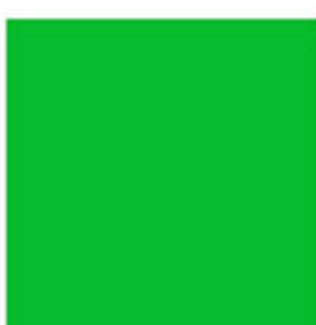
D96260X Chromatint® Bright Green 1707 Liquid pH 7-12