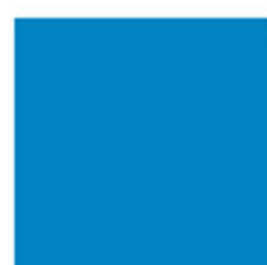
P35003 Chromatint® Blue 3308 Dispersion Стабилен к перекиси. Стабилен в растворах, не оседает.