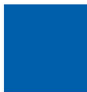
D95019 Chromatint® Blue 2819 Liquid pH стабилен в широком диапазоне