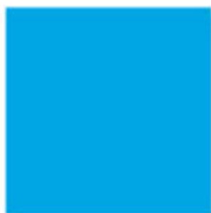
D35003X Chromatint® Blue 0408 Liquid pH стабилен в широком диапазоне, стоек к потере цвета