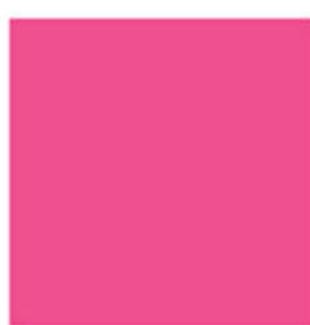
M93010X Chromatint® Red 0551 Liquid Флуоресцентный красный. pH стабилен в широком диапазоне