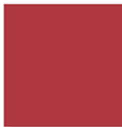
P33000 Chromatint® Red 3208 Dispersion Дисперсия PR 170