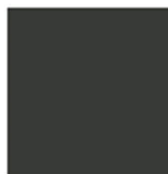
P98001 Chromatint® Black 3449 Dispersion